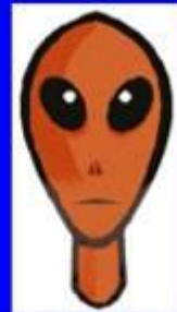
うちゅうじん 宇宙人