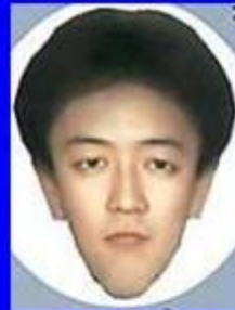
みらいじん 未来人